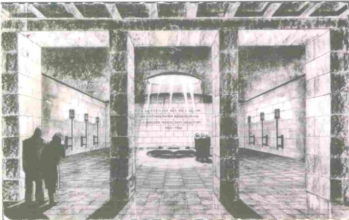
המנומריאל לקרבן היהודי האלמנהי פורים לאחד המלחמה (ארצות יד ושם)

לנו להתמודד עם שאלות השוואתיות כמו מה בין מצב יהודי צפון אפריקה למצב יהודי צרפת או מצב יהודי אירופה בימי מלחמת העולם השנייה. האם העובדה שבצפון אפריקה לא הוקמו מחנות השמדה ולא הייתה השמדה מדירה את שהתרחש שם מההקשר של השואה? והרי גם במאמר זה תמרנו את הניסוחים בין התייחסות ל"שואה בצפון אפריקה" לבין "אירועי מלחמת העולם השנייה". האם המחקר ההיסטורי בשל לקבוע במפורש, הן בעובדות והן בפרשנותן, שצפון אפריקה הייתה גם היא בשואה? האם ההבדלים באופי האירועים בין לוב ותוניסיה לבין אלג'יריה ומרוקו אינם מצריכים דיון נפרד בכל ארץ במקום דיון במרחב שבו ההבדלים משמעותיים כל כך?