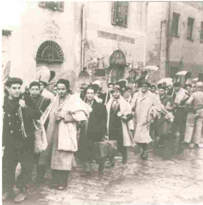
יהודים שגוישו לעבודת כפייה בידי הגרמנים בנוסף ביזרט, תוניסיה 1942

ההפצצות של תוניסיה היו מסוכנות יותר והטרדו את האוכלוסייה היהודית יותר מנכחות הגרמנים ומהפחד מהם.