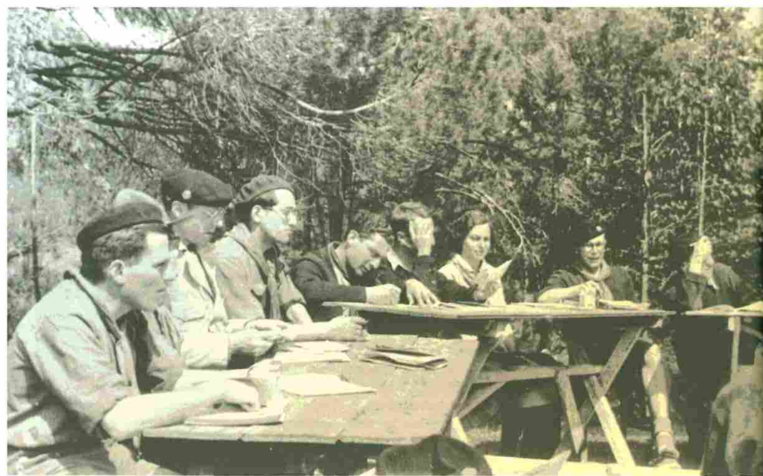
זכרון מנותרת יהודים בצרפת

שהמערכת שלו החליטה להקדיש גיליון עב כרס לשואה בארצות האסלאם. עד אז דומני כי מעולם לא פורסמו בו מאמרים על ארצות האסלאם בתקופה זו.