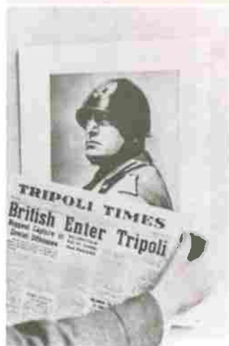
כתבה אנטישמית על כיבוש טריפולי על ידי הבריטים (ארכיון המלחמה בלונדון)